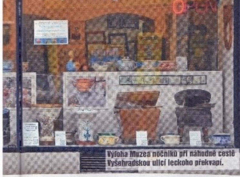
Výloha Muzea nočníků při náhodné cestě Vyšehradskou ulicí leckoho překvapí.