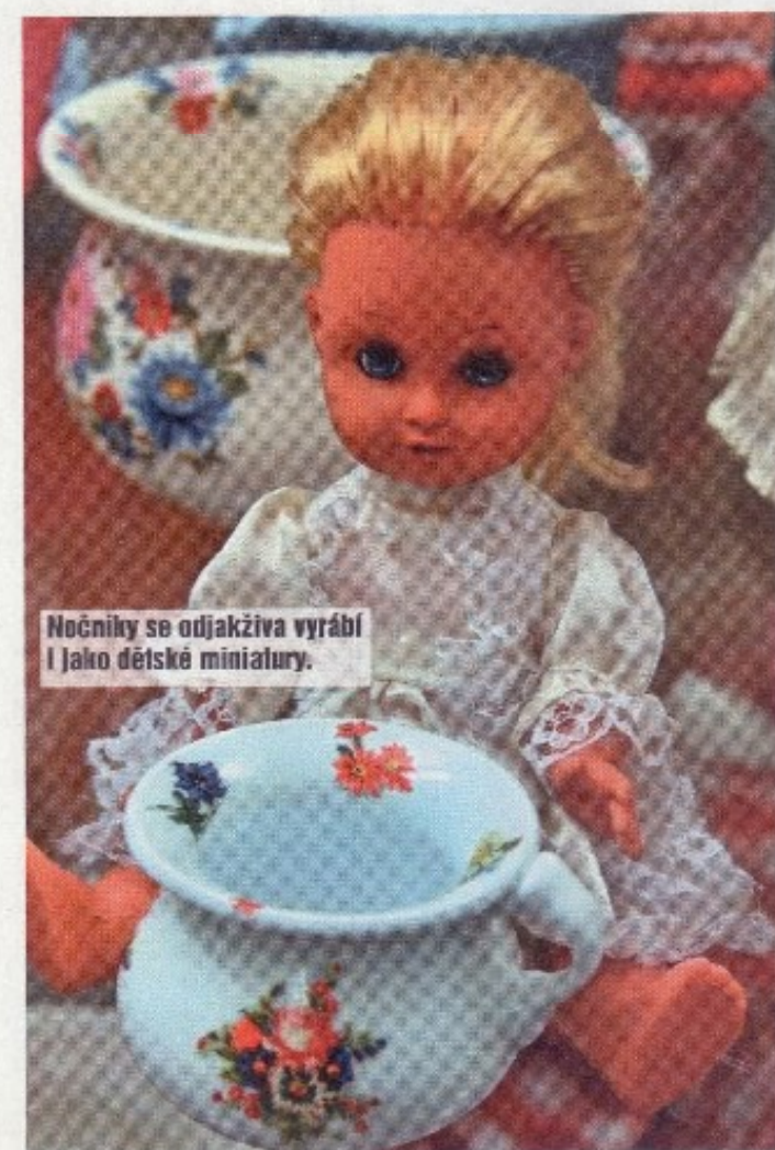
Nočníky se odjakživa vyrábí i jako dětské miniatury.