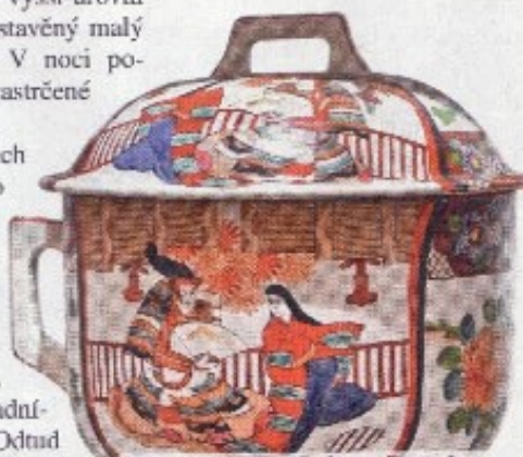
Porcelánový nočník s víkem je z Japonska z pol. 19. století.

Teprve renesance přinesla zlepšení. V roce 1596 sestavil John Harrington pro královnu Alžbětu první water-closet. Tvořila jej nádržka na vodu, vypouštěcí trubky, prkenné sedátko, trubky z nádržky, odpadu a výtoku do žumpy. Voda se dovnitř vpouštěla ventilem a trys-