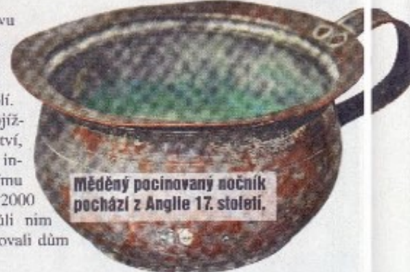
Měděný pocinovaný nočník pochází z Anglie 17. století.

„K historii hygieny není příliš písemných podkladů, takže je poměrně náročné dobrat se věrohodných informací. Nejstarší civilizací, která řešila problematiku záchodů, byla minojská kultura před třemi tisíci lety. Minojský palác měl kromě spousty místností i koupelny s teplotelská vásaň.