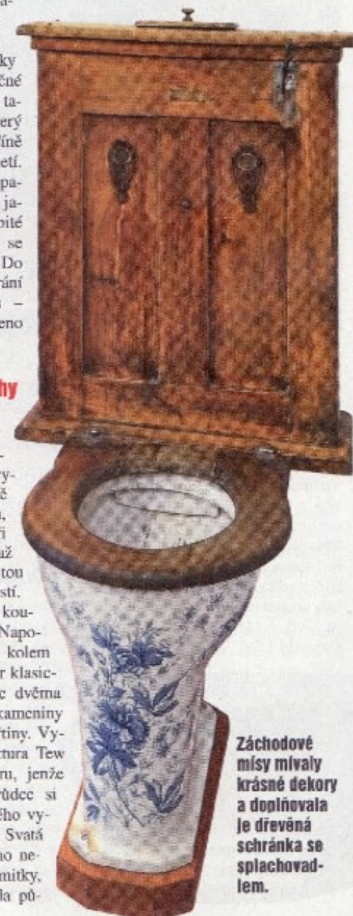
Záchodové mísy mívaly krásné dekory a doplňovala je dřevěná schránka se splachovadlem.

Snad nejdojemnější příběh provází krásnou toaletní soupravu s nočníkem z mléčného opalinového skla, vyrobenou skláři v oblasti Nového Boru kolem roku 1860.